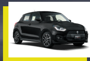
Negro Supremo. 1, 2