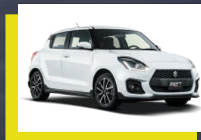
Blanco Pop. 1, 2